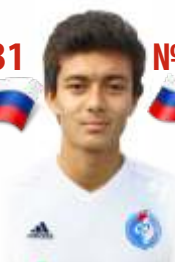
Уан Виктор Полузащитник