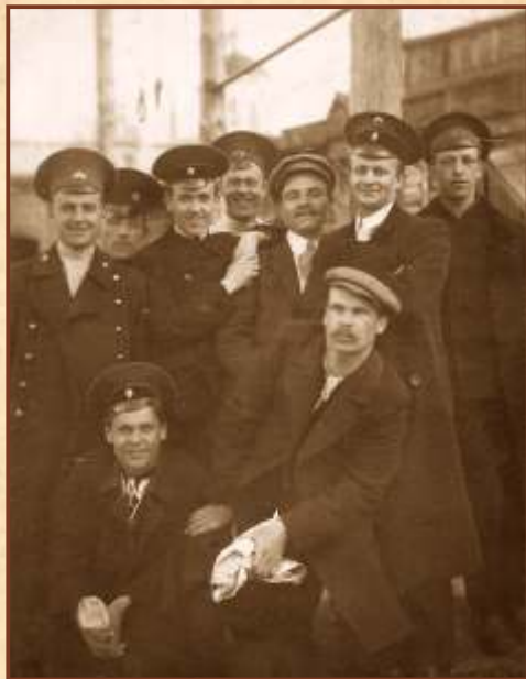
Троицкая футбольная команда (слева направо):

Команда «Унитас» просуществовала до 1918 года, после чего на базе её и воронежской «Веги» при Всевобуче на ЮВЖД была создана команда «Штурм» (с 1925 г. - 1-я участковая ЮВЖД).■