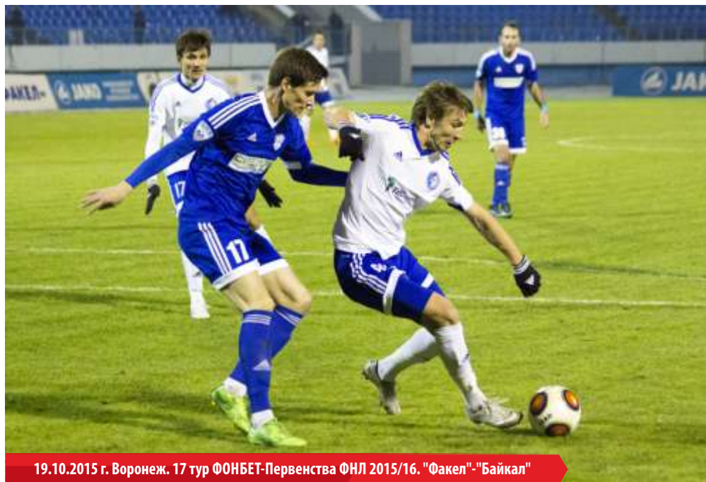
19.10.2015 г. Воронеж. 17 тур ФОНБЕТ-Первенства ФНЛ 2015/16. "Факел"-"Байкал"