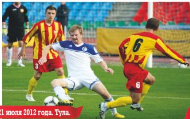
21 июля 2012 года. Тула.